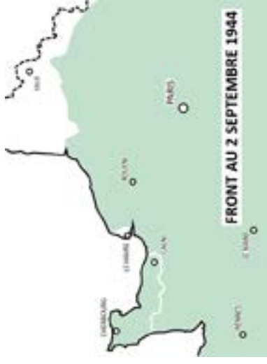
FRONT AU 2 SEPTEMBRE 1944

L'exploitation rapide de cette percée révèle alors le caractère décisif de la bataille qui s'est jouée juste avant. Véritable guerre d'usure, la « Bataille des Haies » a amené les Allemands à leur point de rupture.