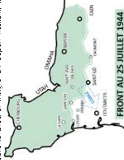
FRONT AU 25 JUILLET 1944

Cet « Enfer des Haies » ne peut plus durer et le 25 juillet 1944, l'opération Cobra est déclenchée. A l'ouest de Saint-Lô, 2500 bombardiers saturent un rectangle de douze kilomètres carrés de 60 000 bombes. Les colonnes blindées s'enfoncent dans la brèche. Malgré un départ hésitant, la