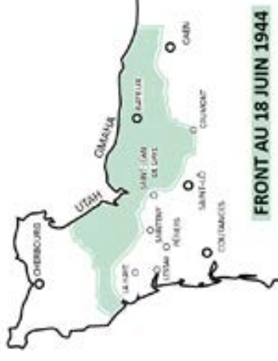
FRONT AU 18 JUILLET 1944

Quand ils s'élancent au sud dans l'espoir de vite atteindre Coutances puis la Bretagne, les Américains de la Première Armée du général Bradley butent aussitôt sur des Allemands renforcés et parfaitement retranchés devant et autour de La-Haye-du-Puits, Sainteny et Saint-Lô.